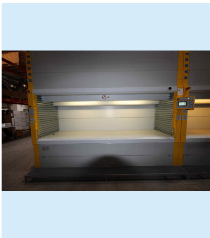
Beispielfoto, Original Fotos folgen in Kürze