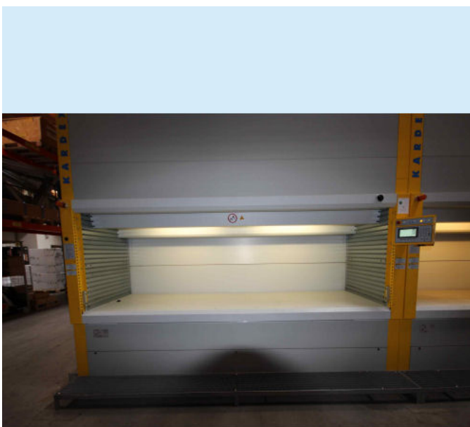
Beispielfoto, Original Fotos folgen in Kürze