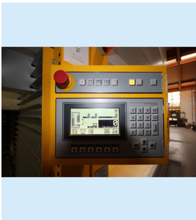
Beispielfoto, Original Fotos folgen in Kürze