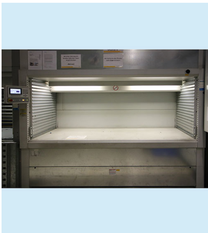
Beispielfotos, Originalbilder folgen in Kürze