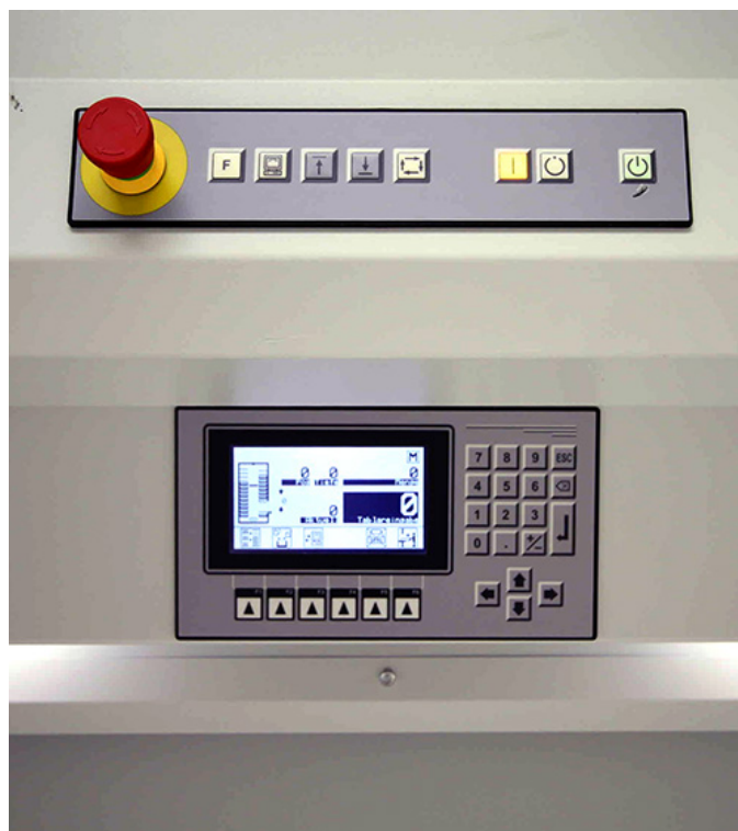
Beispielfotos, Originalbilder folgen in Kürze