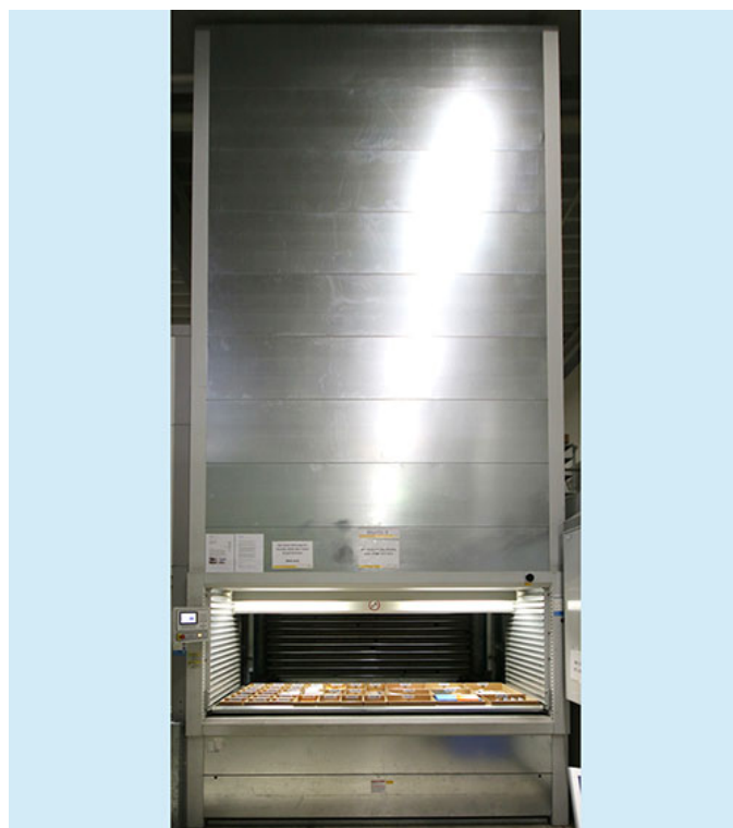
Beispielfotos, Originalbilder folgen in Kürze